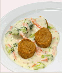
Geflügelklößchen in Gemüse-Joghurtsoße