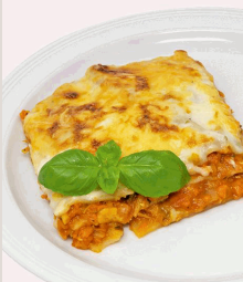
Rote Linsen-Lasagne Nudelteigplatten mit fruchtiger Tomatensoße, roten Linsen, Karotten und Lauch, überbacken mit Käse